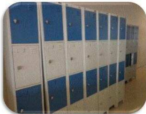
7003902 ARMARIO DE ACO C/02 VAOS CINZA/AMARELO